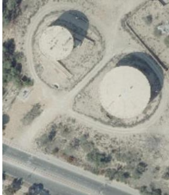
דימונה - 2 בריכות אתר משותף בוסטר אתר נפרד